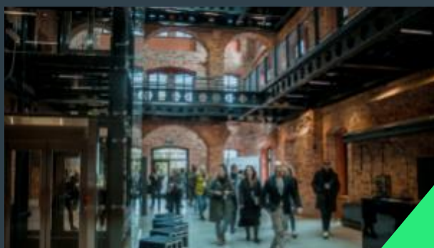
Wydarzenia w Młynach Rothera.