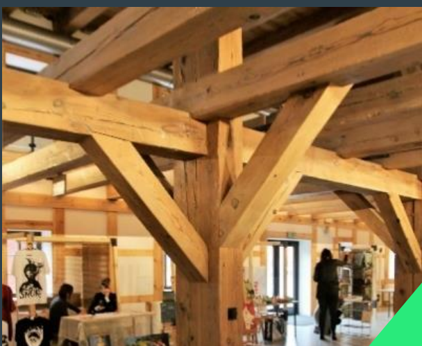
Przekształcone wnętrze właściwego młyna i drewniane konstrukcje we wnętrzu skrzydła dawnego spichrza mącznego.