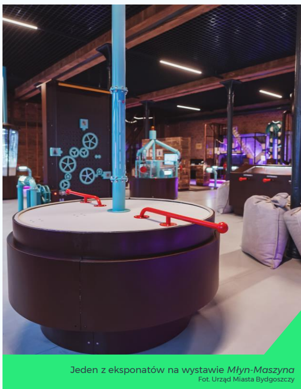
Jeden z eksponatów na wystawie Młyn-Maszyna

Wydaje się, że osoby śledzące stronę internetową instytucji oraz jej media społecznościowe zdecydowanie lepiej oceniają ofertę Młynów.