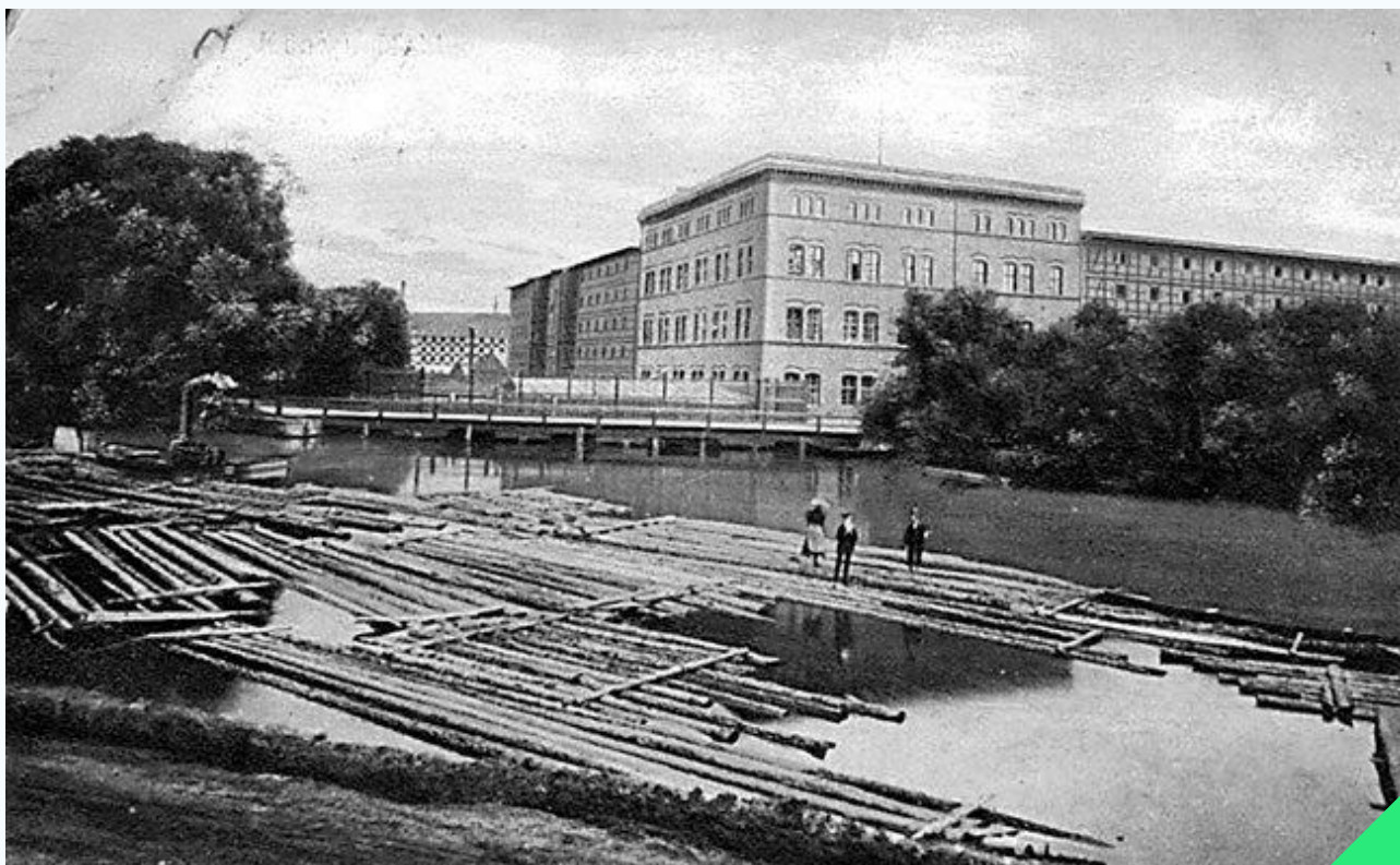
Młyny Rothera na początku XX wieku

Równoległe do prac budowlanych w 2019 r. decyzją władz miasta powołano nową samorządową instytucję Park Kultury, której misją było „wypełnienie życiem” zrewitalizowanej przestrzeni. Z założenia Młyny Rothera miały się stać wielofunkcyjną instytucją społeczno-kulturalną współtworzoną w partnerstwie z lokalną społecznością 8 .