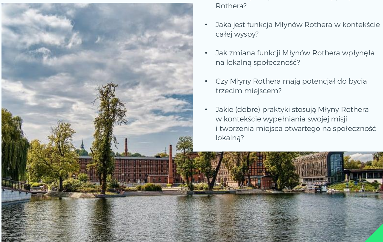
Młyny Rothera na Wyspie Młyńskiej