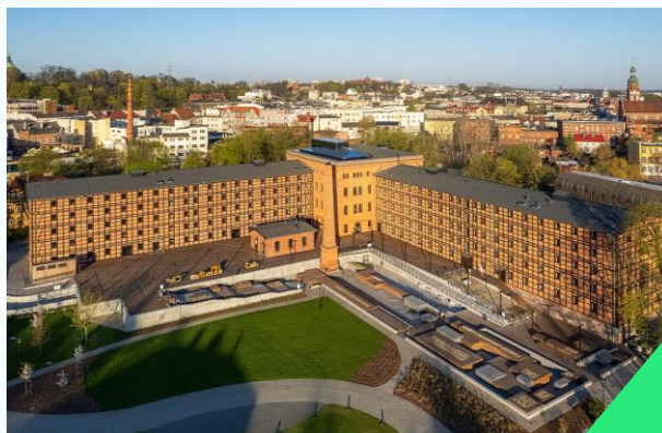
Młyny Rothera

Obecnie nie wszystkie z wymienionych elementów działalności Młynów Rothera zostały oddane do użytku, niemniej prace aranżacyjne trwają, a pracownicy wraz z mieszkańcami, lokalnymi artystami czy organizacjami pozarządowymi stale pracują nad doskonaleniem i wzbogacaniem oferty Centrum Nauki i Kultury.