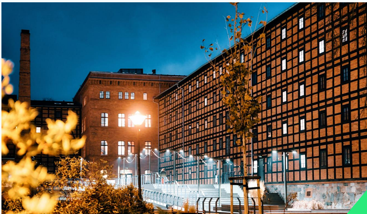
Młyny Rothera po zmroku.

Przyglądając się misji i filozofii prowadzenia działalności, zaangażowaniu i postawie pracowników oraz ofercie programowej, należy zakładać, że w przyszłości (gdy wszystkie planowane funkcje budynku i przestrzenie będą otwarte dla gości) Młyny staną się trzecim miejscem dla wielu mieszkańców Bydgoszczy.