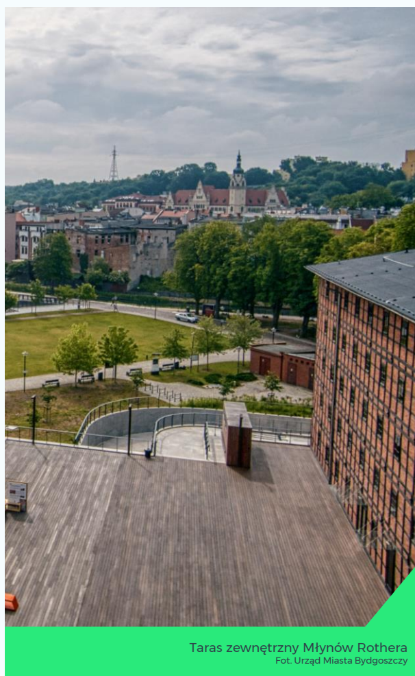
Taras zewnętrzny Młynów Rothera

Taras zewnętrzny również nie jest zadaszony ani wyposażony w parasole – zauważono, że wielu użytkowników poszukuje cienia m.in. przy elewacji budynku czy w okolicy kawiarni, przy której z kolei nie ma miejsc siedzących.