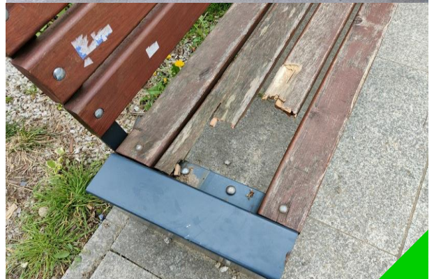
Uszkodzone ławki na skwerze