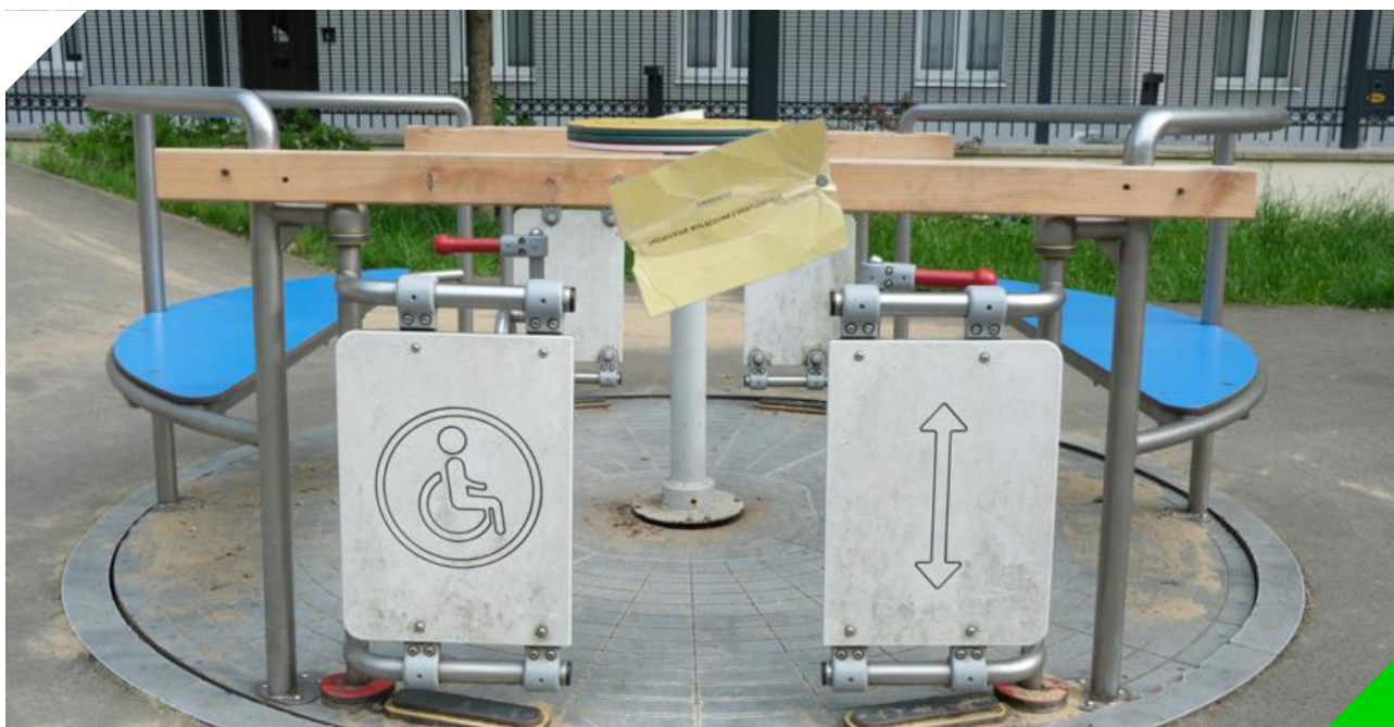
Wyłączona z użytkowania karuzela na placu zabaw

Z drugiej strony pojawiały się również głosy wskazujące, że przestrzenie publiczne powinny być dostępne dla mieszkańców cały czas, a za ich stan techniczny i porządek odpowiedzialne są służby miejskie.