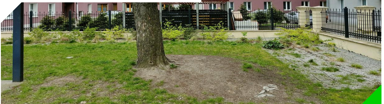
Część trawnika na skwerze