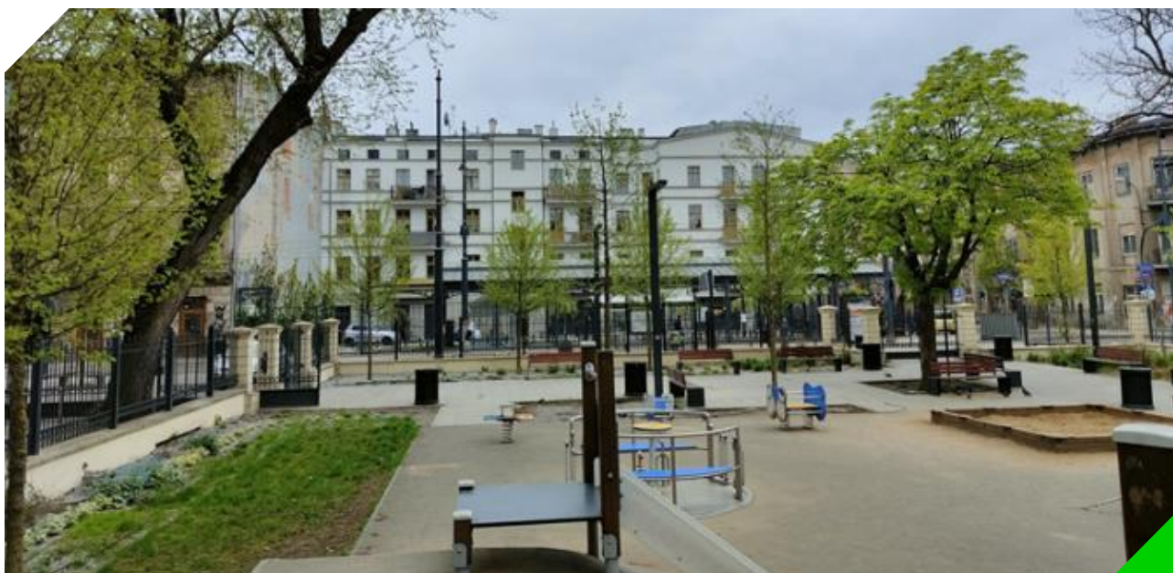
Plac zabaw oraz elementy zieleni na skwerze