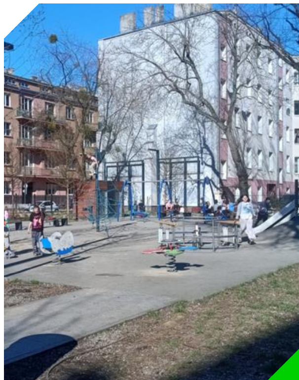
Plac zabaw w wiosenne popołudnie, widok od strony ul. Jaracza

My jako lokatorzy [bez dzieci] właściwie nie użytkujemy tego skweru... raz widziałem sąsiadkę, ale była z dzieckiem.