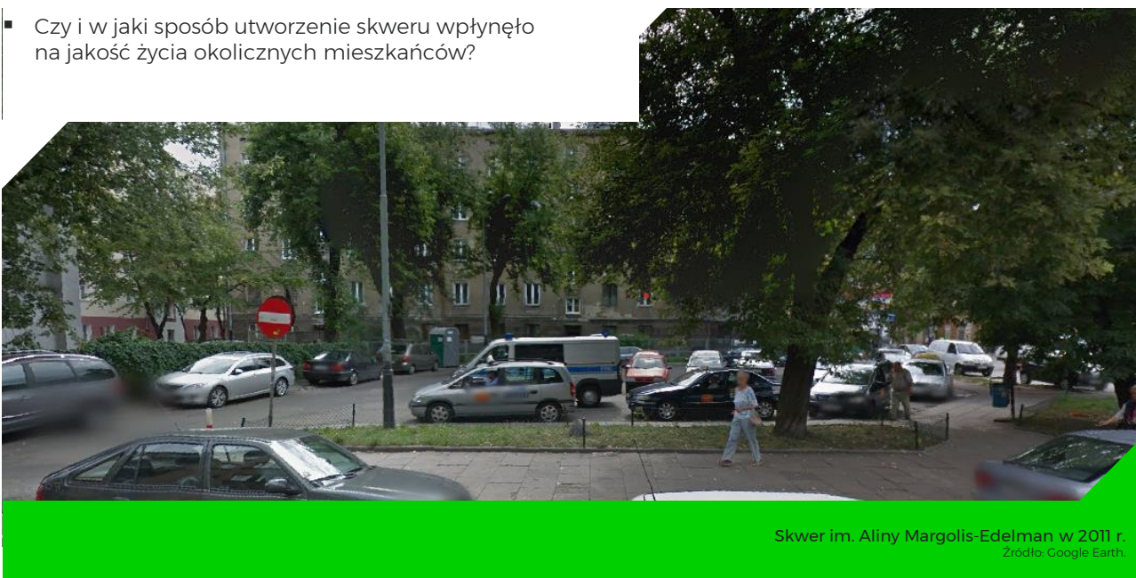
Skwer im. Aliny Margolis-Edelman w 2011 r.

Z danych pozyskanych z Google Earth wynika, że obecny skwer przynajmniej od 2009 r. pełnił funkcję parkingu. Niemniej wydaje się, że teren ten był niezabudowany znacznie dłużej, na co wskazuje obecność zachowanych podczas rewitalizacji kilkudziesięcioletnich drzew.