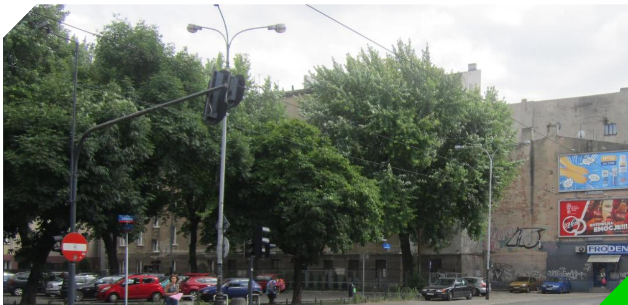
Skwer im. Aliny Margolis-Edelman przed rewitalizacją centrum Łodzi.