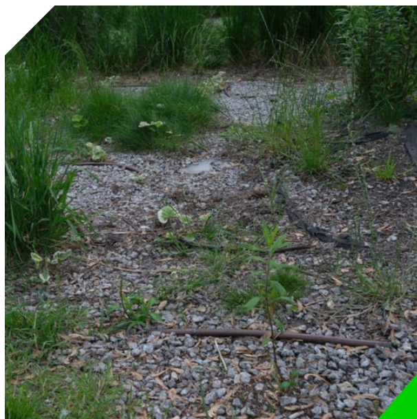
Żwirowe tereny zieleni na skwerze

Co więcej, większość terenów zieleni na skwerze ma żwirową nawierzchnię, która w opinii niektórych badanych nie jest estetyczna, a sam żwir jest przenoszony przez dzieci do piaskownicy, co powoduje jej zanieczyszczenie.