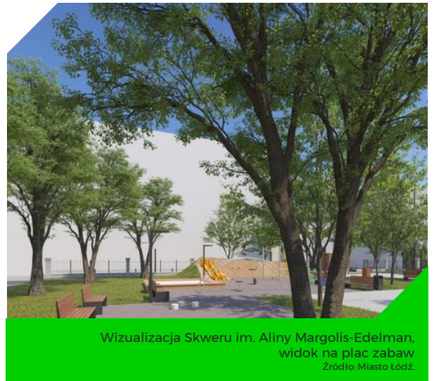
Wizualizacja Skweru im. Aliny Margolis-Edelman, widok na plac zabaw