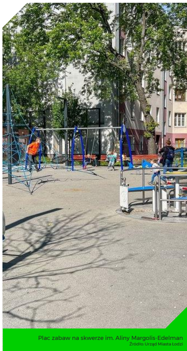
Plac zabaw na skwerze im. Aliny Margolis-Edelman

Z kolei mała architektura i wyposażenie skweru (m.in. w plac zabaw) sprzyjają integracji sąsiedzkiej oraz tworzą miejsce do rekreacji dla mieszkańców okolicy. Zmiana funkcji przestrzeni z parkingu na skwer wpisuje się także w cele urbanistyczne – podnosi jakość tkanki miejskiej oraz ogranicza hałas i ruch samochodowy w najbliższym otoczeniu. Wszystkie te elementy przyczyniają się do poprawy jakości życia w okolicy, co było jednym z głównych celów rewitalizacji.