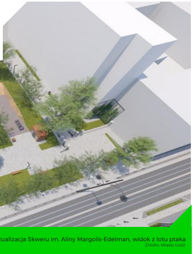
Wizualizacja Skweru im. Aliny Margolis-Edelman, widok z lotu ptaka