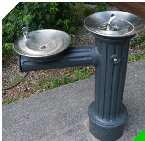
Wodopój na skwerze (nieczynny w trakcie badania)