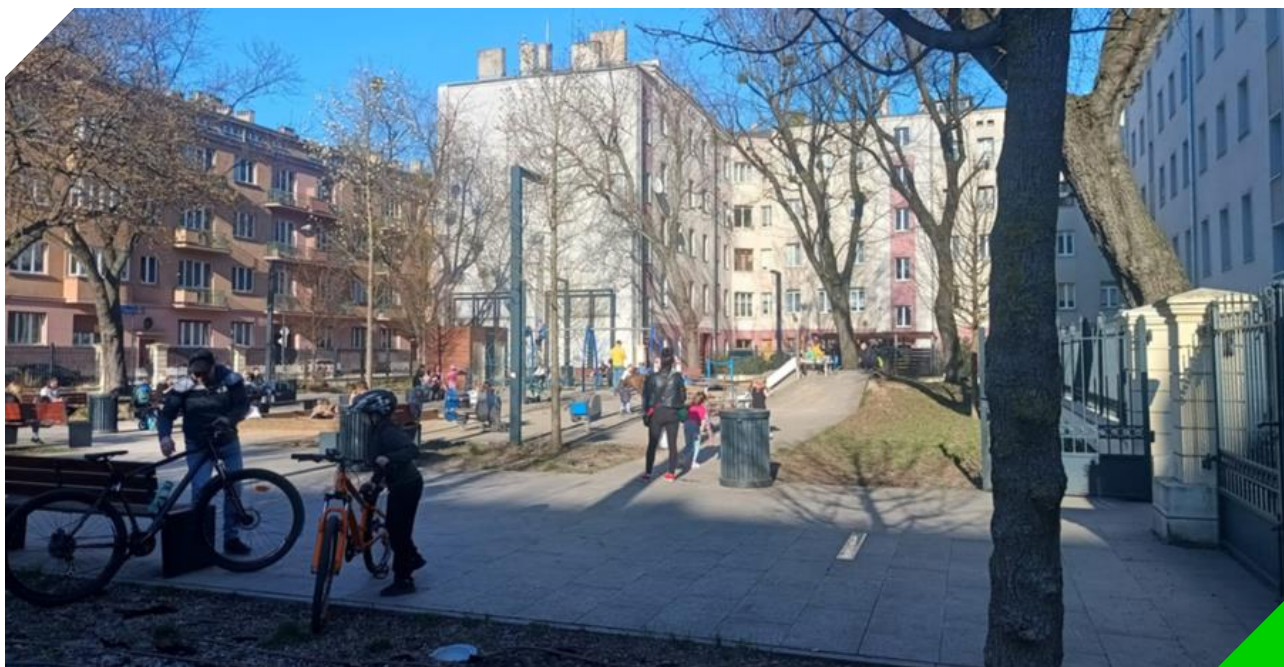
Plac zabaw w wiosenne popołudnie, widok od strony ul. Kilińskiego

Obserwacje prowadzone 5 i 6 kwietnia – w dniach, gdy temperatura była niska – pokazują, że podczas niesprzyjających warunków atmosferycznych młodzi nastolatki byli najliczniejszą grupą użytkowników. Warto również odnotować, że z reguły spędzali czas na skwerze w swoim towarzystwie – bez obecności dorosłych.